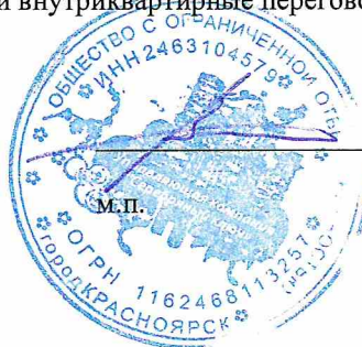
/ В.А. Скрипко